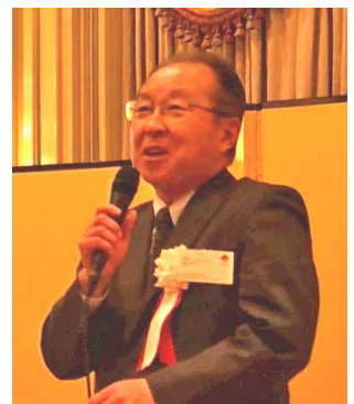
秋葉 賢一 教授